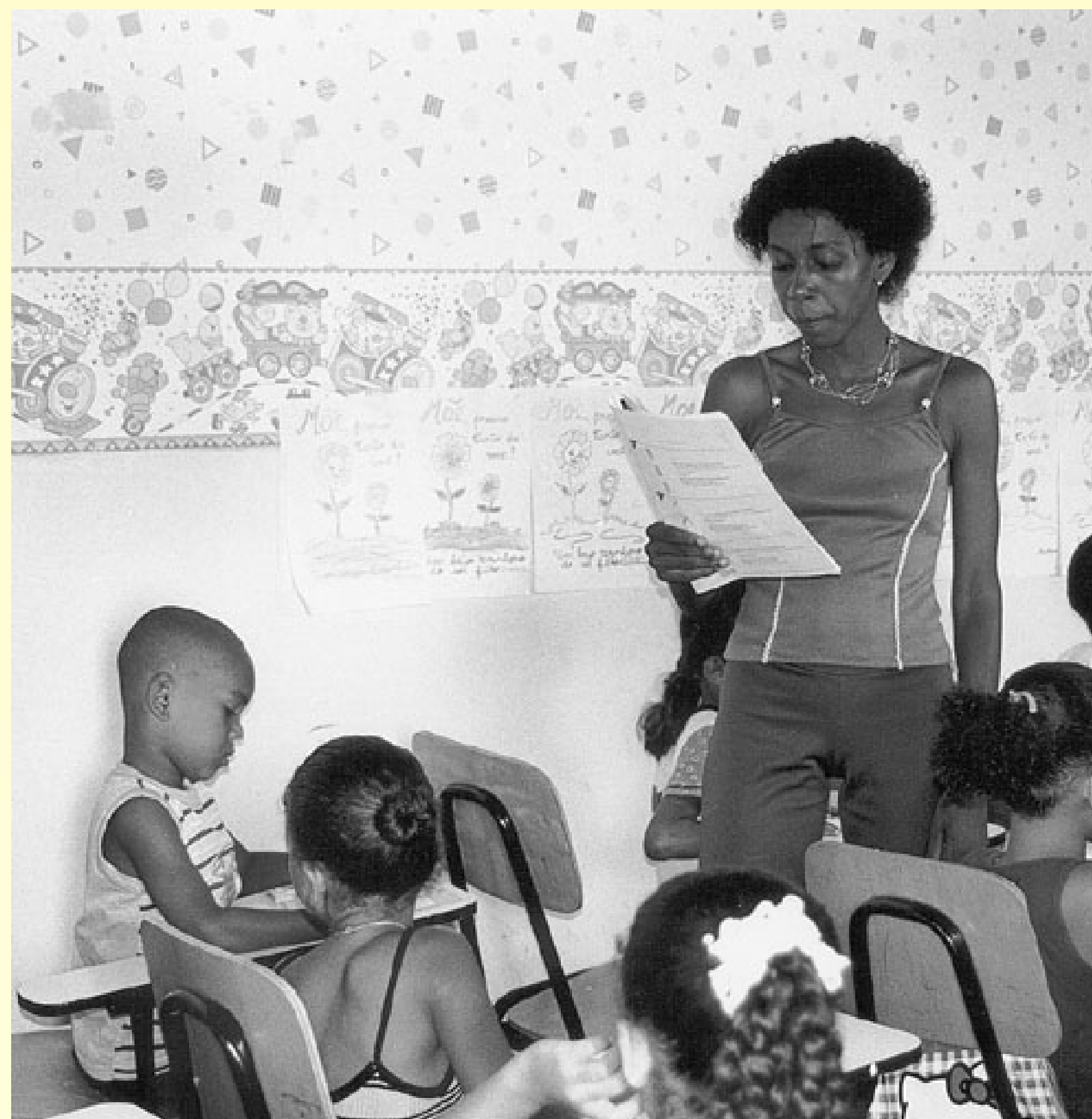
Professora aplicando a Avaliação da Aprendizagem

A UFBA/ISP, através da sua Agência de Avaliação, está realizando a avaliação diagnóstica da aprendizagem dos alunos da 1ª e da 2ª. série do ensino fundamental, inédita na Bahia e concebida pela Secretaria de Educação e Cultura do Estado. A avaliação se processará em larga escala e ocorrerá, num primeiro momento, em julho de 2001, em 130 municípios baianos, abrangendo 1510 escolas e um universo de aproximadamente 285 mil alunos. O primeiro passo dado com vistas ao teste de julho foi a oficina pedagógica para elaboração de descritores que objetivou a definição das competências e habilidades a serem evidenciadas pelos alunos com relação ao domínio dos conteúdos de Português e Matemática de cada unidade de ensino a ser avaliada.