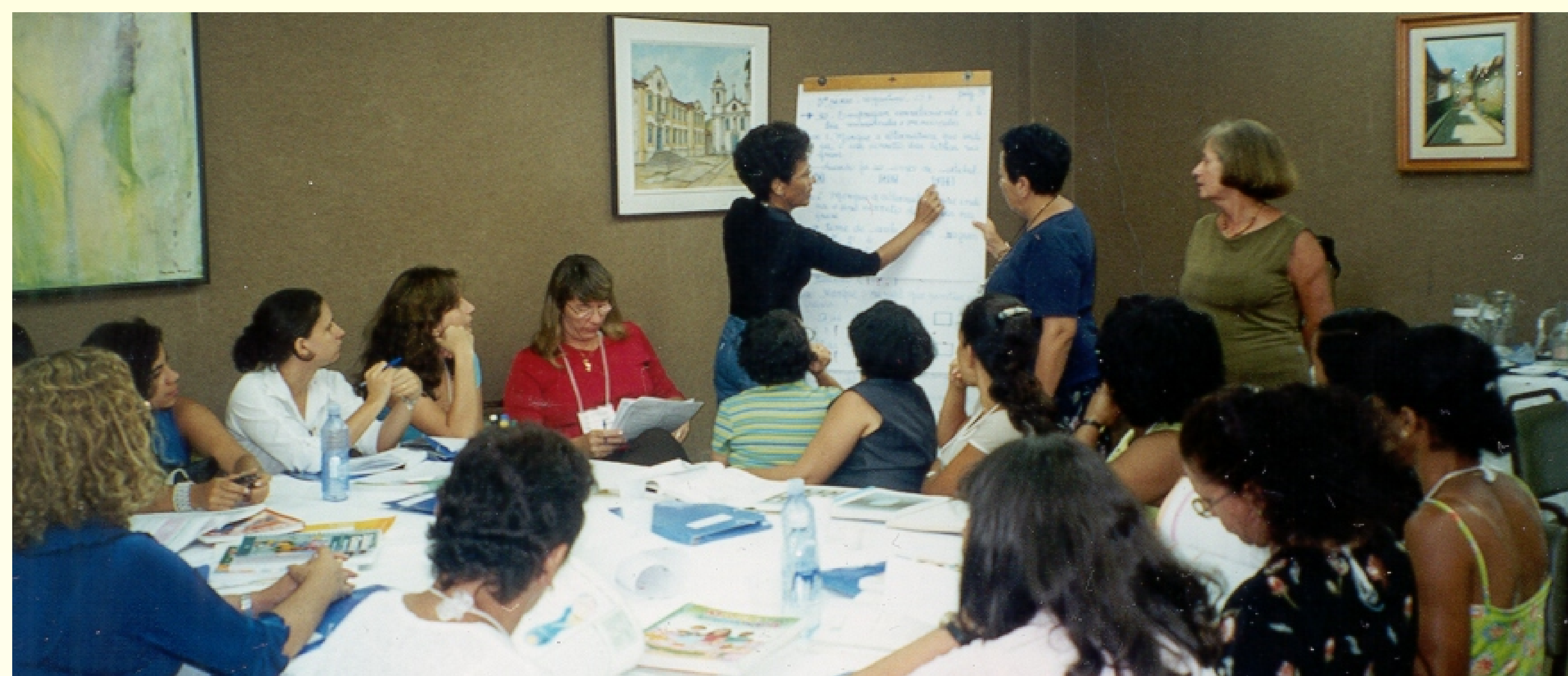
Professores baianos criando os descritores para a Avaliação da Aprendizagem

ÓRGÃO FINANCIADOR: Secretaria de Educação do Estado da Bahia.